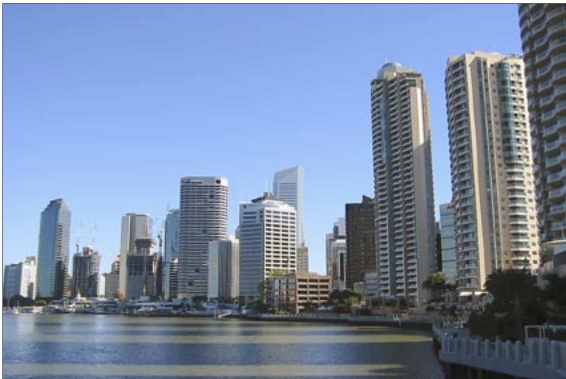
Skyline von Brisbane