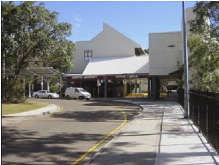
Nathan Campus der Griffith University, Foto: M. Kieserling

Die Australier sind sehr freundlich und hilfsbereit, und in mancher Hinsicht auch zivilisierter als wir. Man wird in Australien nur selten eine pampige Reaktion bekommen, wenn man aus Versehen jemanden anrempelt; meistens hört man von beiden Seiten ein „sorry“.