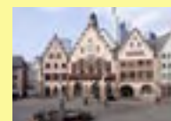
Roemerberg incl. town hall

Guided city walk (2,5h) "History and presence of Frankfurt" start: Kaiserplatz kindly supported by HfB