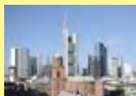
COMMERZBANK tower largest skyscraper in Europe

Reunion Dinner "Zum Schwarzen Stern" Roemerberg 6